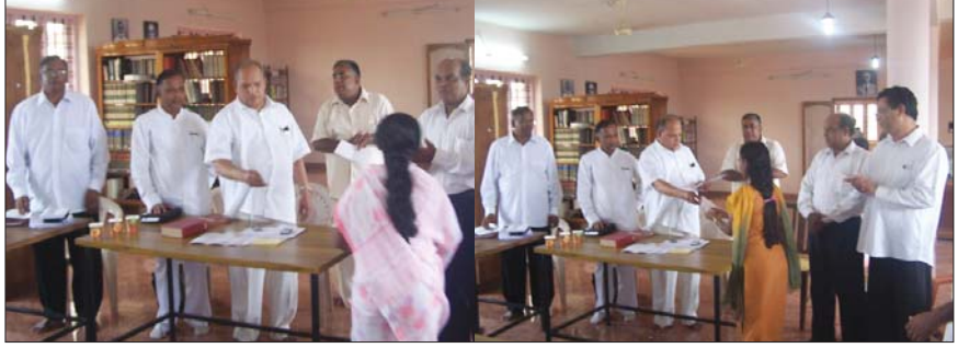
കേരളാ സ്റ്റേറ്റിന്റെ വകയായുള്ള വിവാഹസഹായങ്ങൾ കൊടുക്കുന്നു.