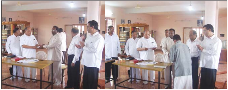
കേരളാ സ്റ്റേറ്റിന്റെ സഹായം റീജിയൻ ഓവർസിയർക്ക് കൈമാറുന്നു. റീജിയൻ ഓവർസിയർ സഹായവിതരണം നടത്തുന്നു.