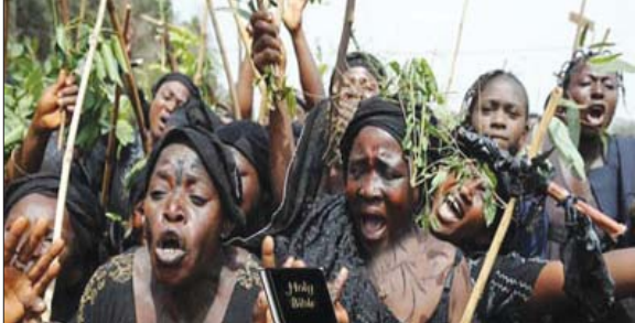
ക്രിസ്ത്യൻ സ്ത്രീകൾ ബെബിൾ കയ്യിലേതി കറുത്ത വസ്ത്രം ധരിച്ച് ശാന്തിയാത്ര നടത്തുന്നു.

നൈജീരിയ: പട്ടാളത്തിന്റെ സഹായത്തോടെ മുസ്ലീം തീവ്രവാദികൾ നൈജീരിയയിൽ ക്രിസ്ത്യാനികളെ കൊന്ന തള്ളുന്നു. മാർച്ച് 17-ാം തീയതി ബെയ്വില്ലെ ജിൽപ്പട്ട 12 ക്രിസ്ത്യാനികളെയാണ് അതിദാരുണമായി കൊന്നത്. ഗർഭവതിയായ ഒരു സ്ത്രീയുടെ ഉദരം പിളർന്ന് കുഞ്ഞിനെ പുറത്തെടുത്ത് കഷണങ്ങളാക്കിയാണ് കൊന്ന തള്ളിയത്. മാർച്ച് ആദ്യം ക്രിസ്തീയ വിരോധികൾ നടത്തിയ കൂട്ടക്കൊലയിൽ പ്രതിഷേധിച്ചുകൊണ്ട് ക്രിസ്ത്യൻ സ്ത്രീകൾ ബെബിൾ കയ്യിലേതി കറുത്ത വസ്ത്രം