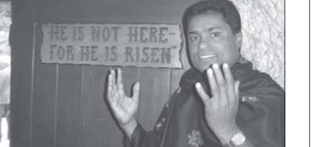
"അവൻ ഉയിർത്തെഴുന്നേറ്റു. അവൻ ഇവിടെ ഇല്ല. അവനെ വെച്ച സ്ഥലം ഇത്" യേശുശലേമിൽ യേശുവിനെ അടക്കം ചെയ്ത കല്ലറയ്ക്ക് സമീപം അച്ചൻകുത്ത് ഇലന്തുരി

യേശുശലേമേ യാത്രയ്ക്കുള്ള സീറ്റുകൾ ഉടൻ തന്നെ ഉറപ്പാക്കുക ഫോൺ: 0469 2634321, 9847166994